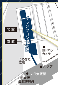
北館4Fフロアマップ